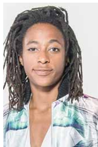
Shirley SOUAGNON Humoriste/Productrice