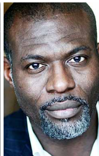
Eriq EBOUANEY Comédien/producteur