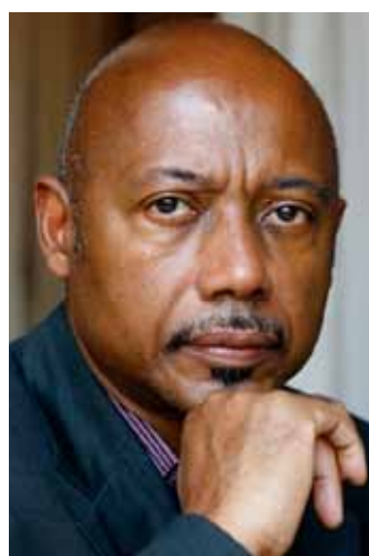
Raoul PECK scénariste/réalisateur Président de la FEMIS