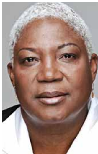
Firmine RICHARD Comédienne