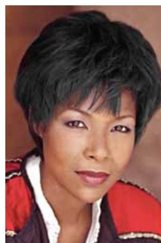
Euzhan PALCY Réalisatrice/productrice