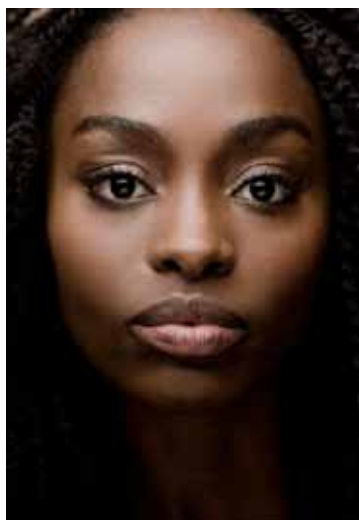
Aïssa MAIGA Comédienne/réalisatrice